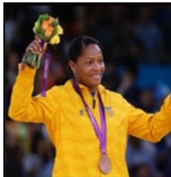
Yuri Alvear le pidió a Dios ganar

La judoca colombiana, Yuri Alvear, ganó este miércoles la medalla de bronce de los Juegos Olímpicos, en la categoría 70 kilos, al vencer a la china Fei Chen, convirtiéndose en la primera preseña de judo para Colombia.