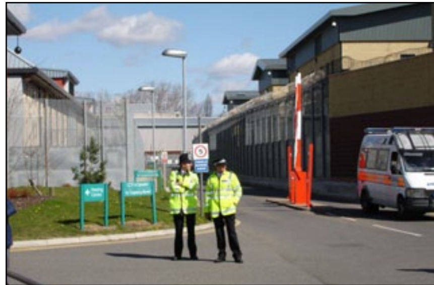
Foto sup.: Entrada principal del centro de detención Harmondsworth. Foto izq: Lugar de visitas